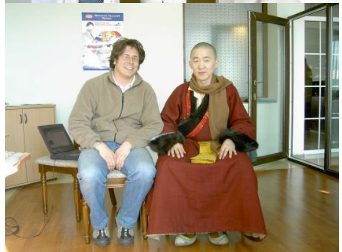
Der ehrenwerte Lama Zava Damdin Renpoche Lobsangdargaya